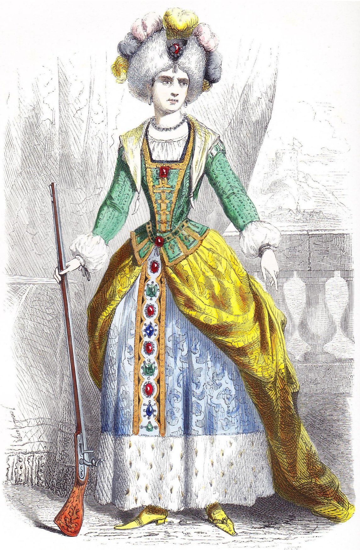
PRINCESSE RÁKÓCZI I.